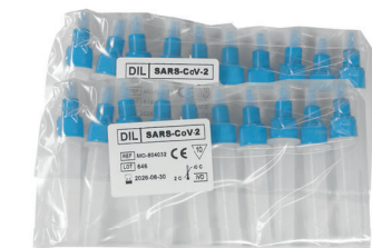
20 VIALES CON DILUYENTE